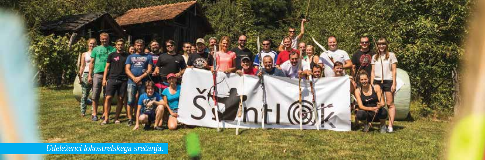
Udeleženci lokostrelskega srečanja.