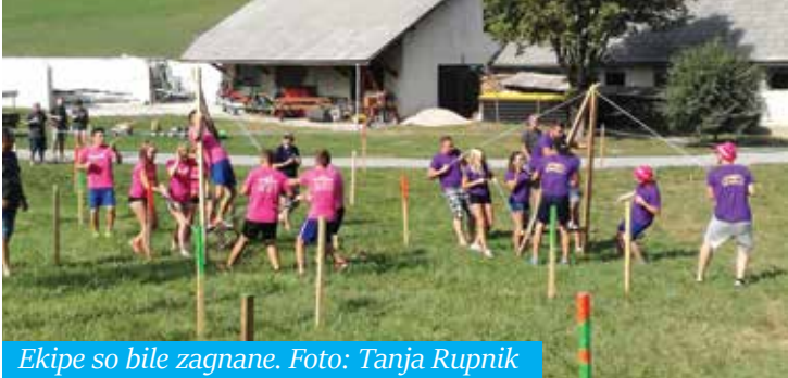
Ekipe so bile zagnane.