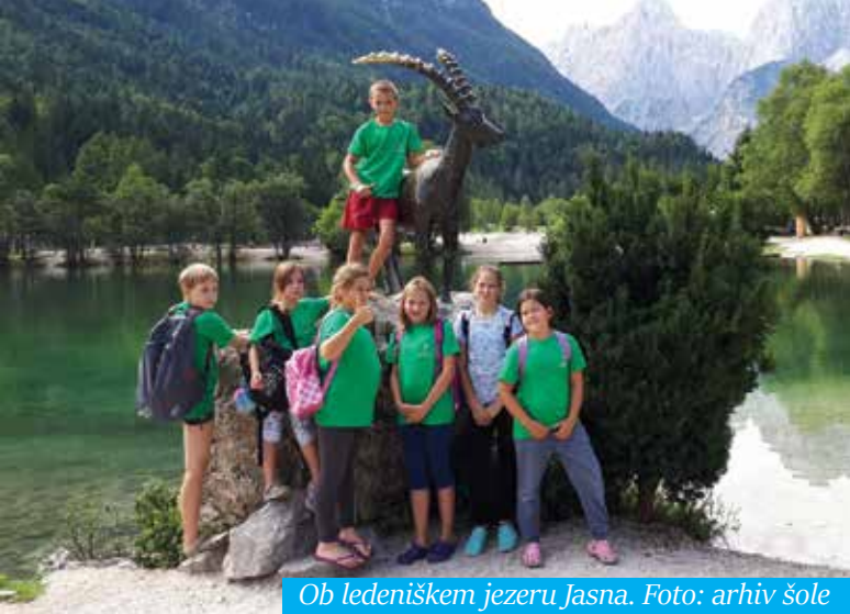
Ob ledeniškem jezeru Jasna.