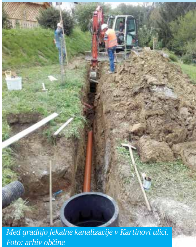
Med gradnjo fekalne kanalizacije v Kartinovi ulici.

V Kartinovi ulici in delu Gubčeve ulice v Šmarju pri Jelšah je javno komunalno podjetje OKP Rogaška Slatina v minulih dneh končalo izgradnjo fekalne kanalizacije. Priključitev objektov na javno kanalizacijsko omrežje je tako že mogoča. (SJ)