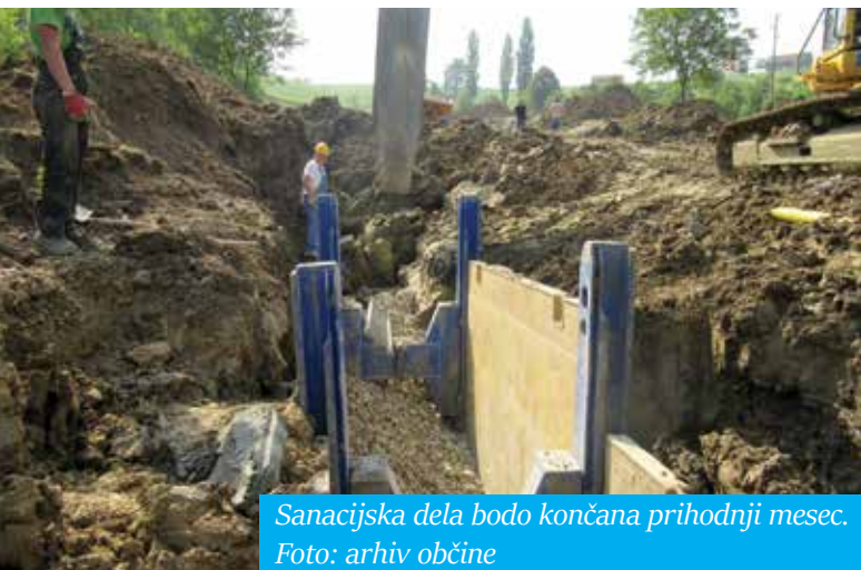
Sanacijska dela bodo končana prihodnji mesec.