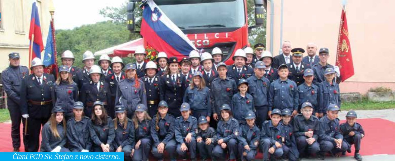
Člani PGD Sv. Štefan z novo cisterno.