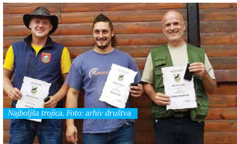
Najboljša trojica.