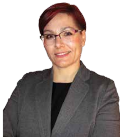
Piše: Sergeja Javornik, odgovorna urednica

Po dvomesečnem premoru smo ponovno v vaših domovih. Poletni čas je vsak po svoje izkoristil – ob morju, v planinah, naokoli po svetu, doma ... Sodeč po novicah iz društev, klubov, javnih zavodov in drugih ustanov na območju občine Šmarje pri Jelšah, prevelikega oddiha ni zaznati. Potekale so prireditve za majhne in velike, jubilejne slovesnosti, družili in sodelovali ste. Kot toliko let, mesecev, tednov doslej. Večji del poletnega utripa predstavljamo v prvi letošnji jesenski izdaji občinskega glasila.