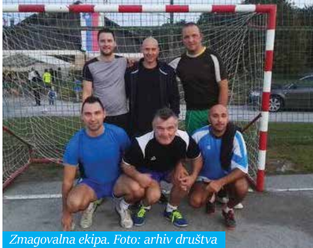
Zmagovalna ekipa.