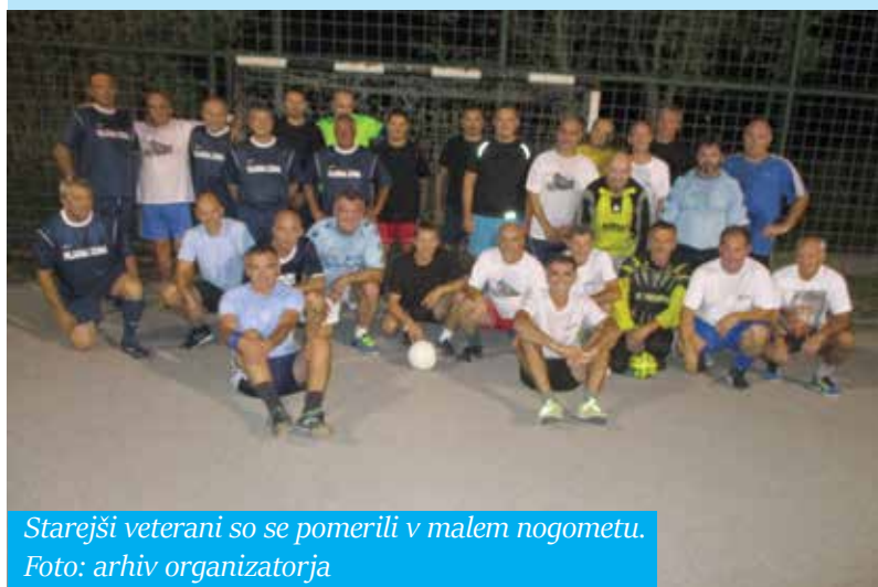
Starejši veterani so se pomerili v malem nogometu.