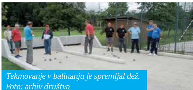
Tekmovanje v balinanju je spremljal dež.