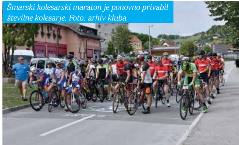
Šmarski kolesarski maraton je ponovno privabil številne kolesarje.

Tampex Šmarje in kavarnica Urška s svojo ponudbo na prireditvi! Vsem skupaj se zahvaljujemo. Vsekakor pa ne smemo pozabiti članov Športnega društva Šmarje, ki so tako ali drugače pomagali pri izvedbi. Vsekakor ob zahvali pričakujemo tudi sodelovanje in obilo dobre volje v prihodnjem letu, ko bo na vrsti 15. Šmarski kolesarski maraton.