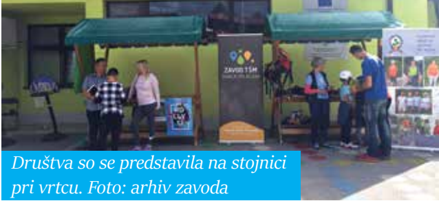
Društva so se predstavila na stojnici pri vrtcu.