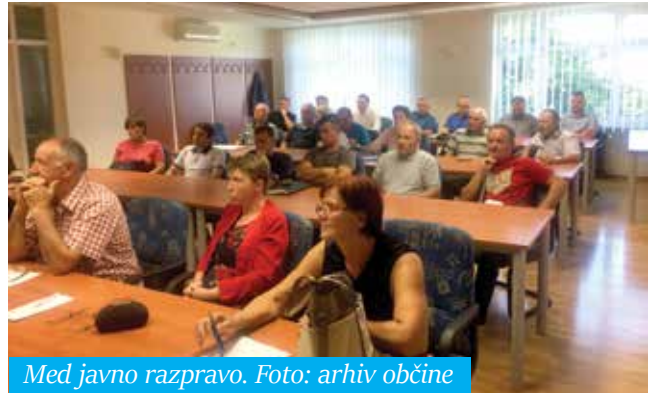
Med javno razpravo.

Javna razgrnitev temeljnega prostorskega akta občine je potekala od 18. julija do 31. avgusta v prostorih občine, 23. avgusta je bila organizirana javna obravnava. Na javno razgrnjen dokument so občani dali kar nekaj pripomb. Med bolj odmevnimi je vsekakor pripomba 146 podpisanih krajanov