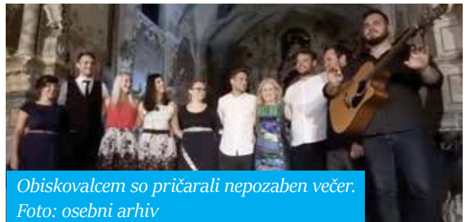
Obiskovalcem so pričarali nepozaben večer.