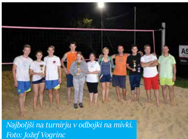
Najboljši na turnirju v odbojki na mivki.