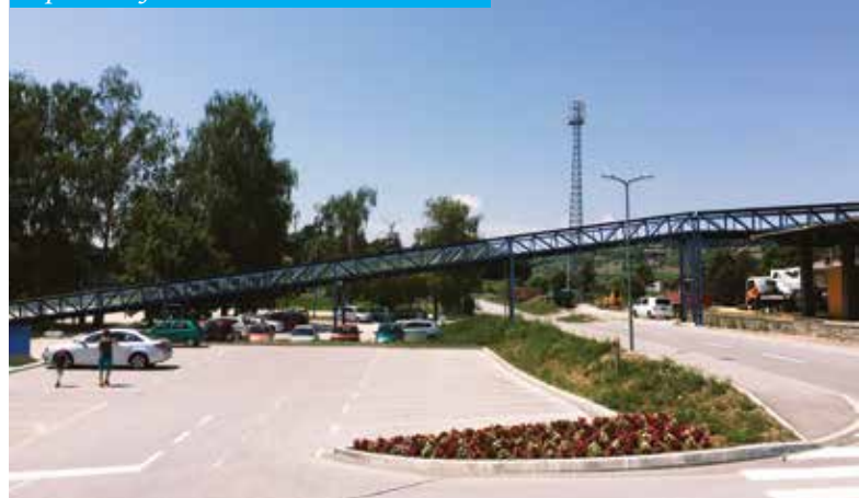
Kdo bo gradil nadhod, bo znano v prihodnjih dneh.

Minuli ponedeljek je bilo odpiranje ponudb, prispelih na novo javno naročilo Občine za izgradnjo nadhoda v Šmarju pri Jelšah. Celjsko gradbeno podjetje Luga-riček je namreč v prvem tednu septembra odstopilo od pogodbe zaradi finančnih težav, v katerih se je znašlo. Zato sta Občina Šmarje pri Jelšah in Direkcija Republike Slovenije za infrastrukturo pripravili novo razpisno dokumentacijo, tako da je bilo novo javno naročilo objavljeno 12. septembra. Kdaj bo izvajalec izbran, še ni mogoče napovedati, bomo pa javnost o tem obvestili na spletni strani. (SJ)