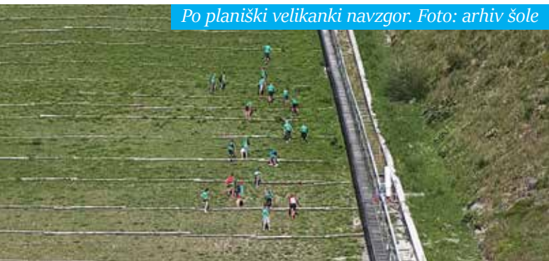
Po planiški velikanki navzgor. Foto: arhiv šole