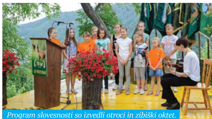
Program slovesnosti so izvedli otroci in zibiški okteti.