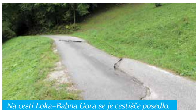
Na cesti Loka-Babna Gora se je cestišče posedlo.