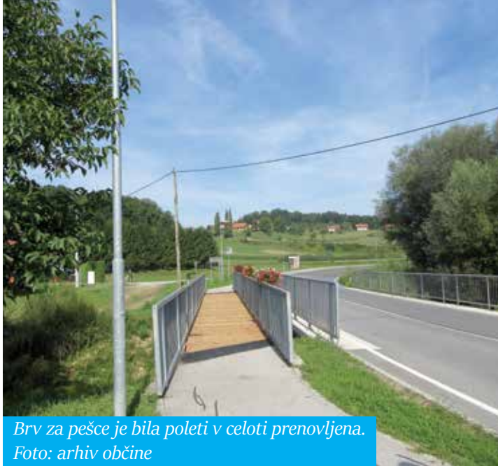
Brv za pešce je bila poleti v celoti prenovljena.

Denar za prenovo naj bi Občina Šmarje pri Jelšah prejela od banke preko unovčitve bančne garancije. (SJ)