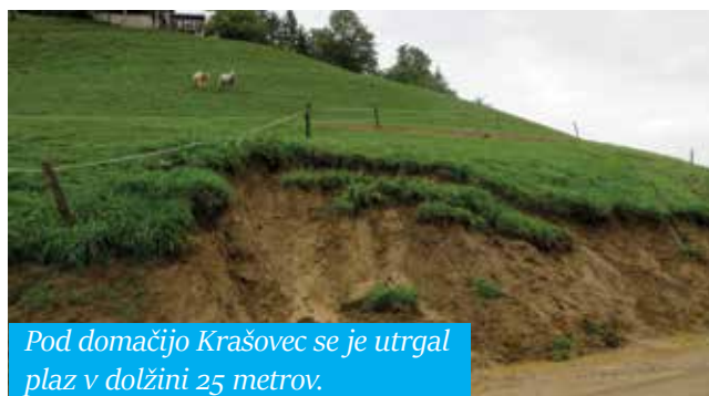
Pod domačijo Krašovec se je utrgal plaz v dolžini 25 metrov.