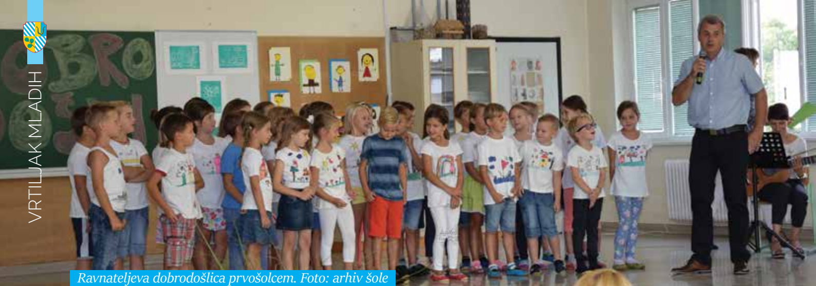
Ravnateljova dobrodošlica prvošolcem.