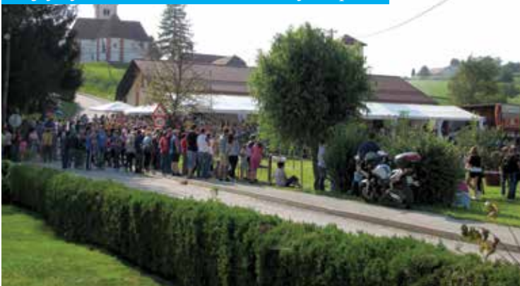
Gledalci so z velikim zanimanjem spremljali dogajanje na tekmovališču.