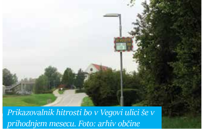
Prikazovalnik hitrosti bo v Vegovi ulici še v prihodnjem mesecu.

V juliju je bilo zabeleženih nekaj manj kot 51 tisoč meritev oziroma slabih 20 tisoč prevozov (en prevoz je lahko izmerjen večkrat), avgusta več kot 62.500 meritev oziroma nekaj manj 24 tisoč prevozov (en prevoz je lahko izmerjen večkrat). Do 20. septembra