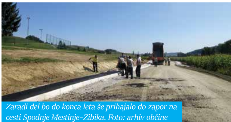
Zaradi del bo do konca leta še prihajalo do zapor na cesti Spodnje Mestnje–Zibika.

Nemoteno in brez težav poteka izgradnja prizidka v podružnični šoli na Svetem Štefanu. Naložbo izvaja celjsko gradbeno podjetje Remont. Pogodbeni rok za končanje del je konec leta. (SJ)