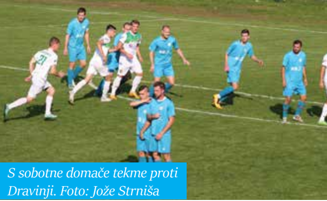
S sobotne domače tekme proti Dravinji.