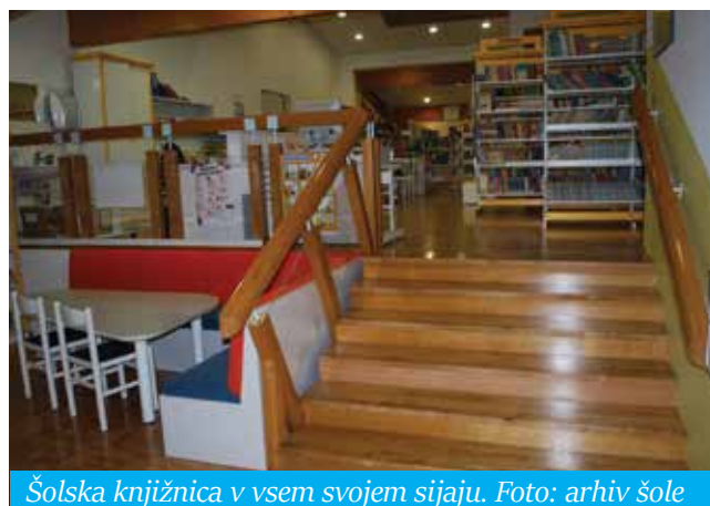
Šolska knjižnica v vsem svojem sijaju.