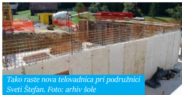
Tako raste nova telovadnica pri podružnici Sveti Štefan.