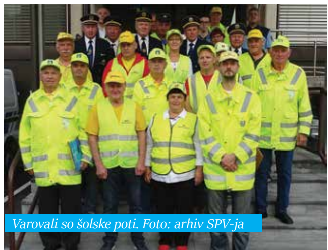
Varovali so šolske poti.