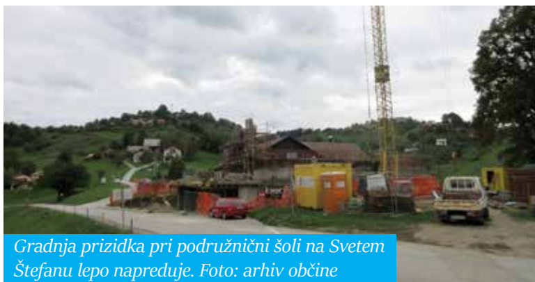
Gradnja prizidka pri podružnični šoli na Svetem Štefanu lepo napreduje.