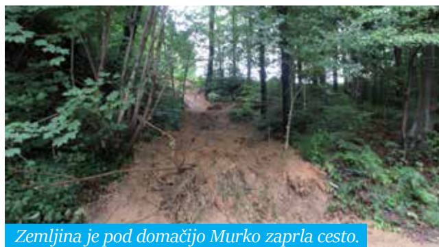
Zemljina je pod domačijo Murko zaprla cesto.

Še en plaz je evidentiran v naselju Zgornje Tinsko. Pri rekonstrukciji zasebnega dovoznega priključka do stanovanjskega objekta se je zaradi padavin sprožil plaz, ki objekta ne ogroža, sta pa močno poškodovana parkirišče in dovozna cesta.