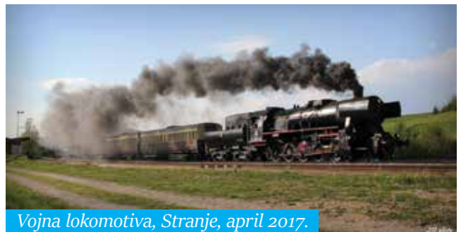
Vojna lokomotiva, Stranje, april 2017.

23-metrška in 140-tonska lokomotiva je bila izdelana v Nemčiji 1944. leta. Razvita je bila z namenom robustne